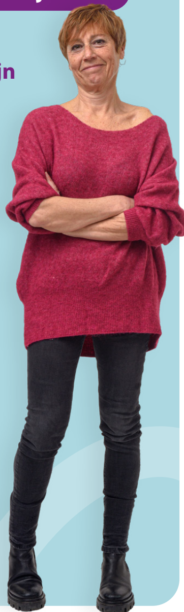
7 JAAR STERK IN JE WERK

"Sterk in je werk is goed voor elke collega in zorg en welzijn. Of je het nu even niet meer weet of gewoon een check-up wilt."