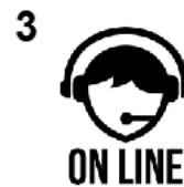
Bekwaam in online werken